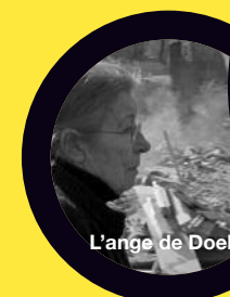
L'ange de Doel