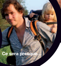
Ce sera presque...